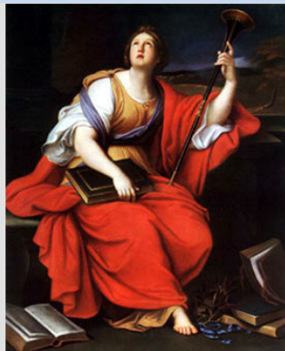
Clío, musa de la historia P. Mignard, 1689

Entre todas las expresiones literarias de Occidente, la griega se destaca por la originalidad de sus manifestaciones, la permanencia de su modelo y su comprensión profunda del espíritu humano.